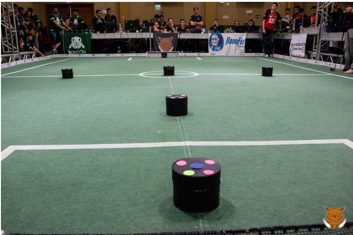
Grupo Warthog na Competição Brasileira de Robotica, realizada em Rio Grande – RS, 2019.