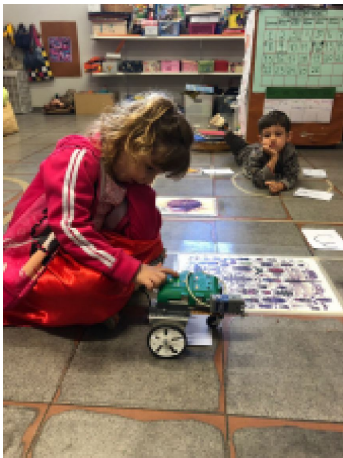
Alunos da creche USP São Carlos pressionando o botão de execução do robô