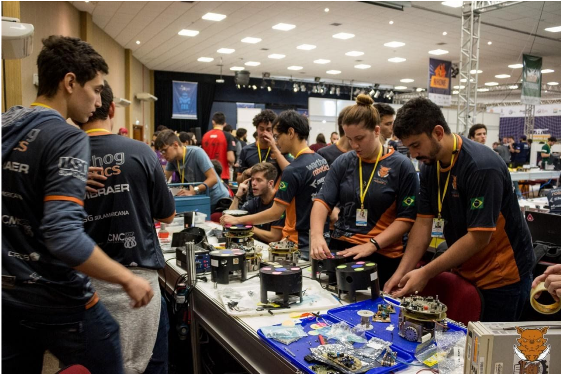
Grupo Warthog na Competição Brasileira de Robotica, realizada em Rio Grande – RS, 2019