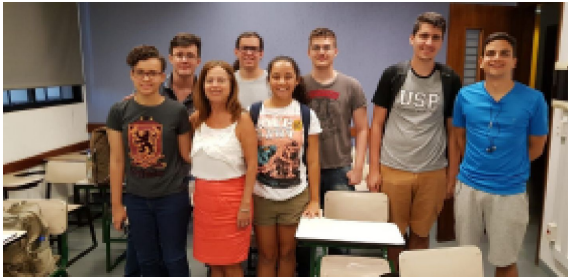
Coordenadora e monitores participantes deste Projeto