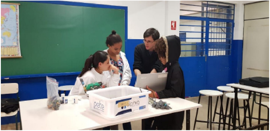
Bolsista auxiliando os alunos com exercício de movimentação do robô