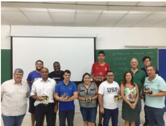
Coordenadora e Bolsista com os alunos do curso de extensão: Robótica III