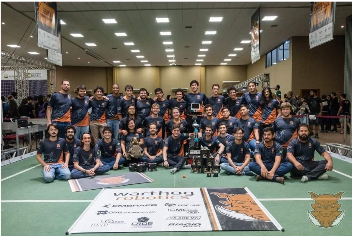
Grupo Warthog na Competição Brasileira de Robotica, realizada em Rio Grande – RS