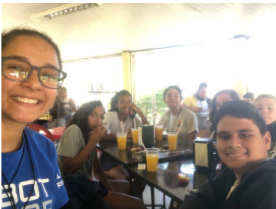
Bolsista acompanhando os alunos do Projeto Pequeno Cidadão na Olimpíada Brasileira de Robótica