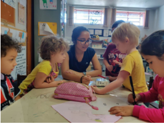
Bolsista ministrando aula para as crianças da Creche da USP São Carlos