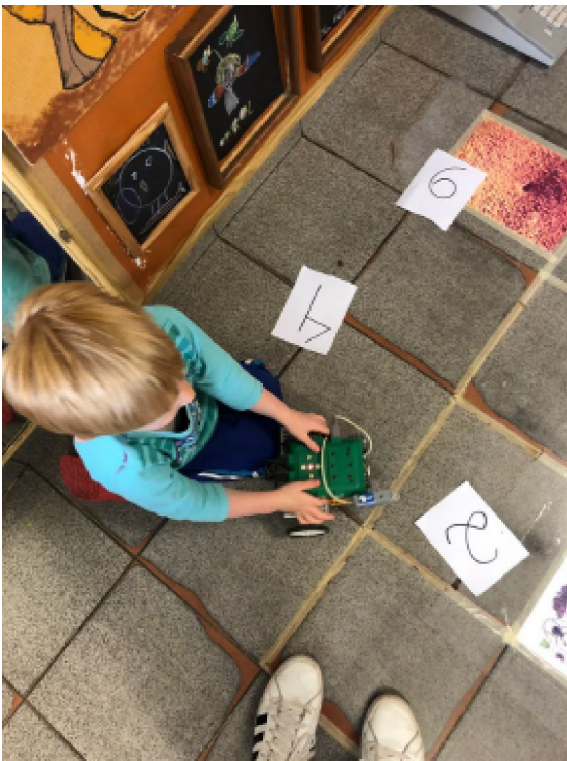
Aula de números utilizando robôs na Creche da USP São Carlos